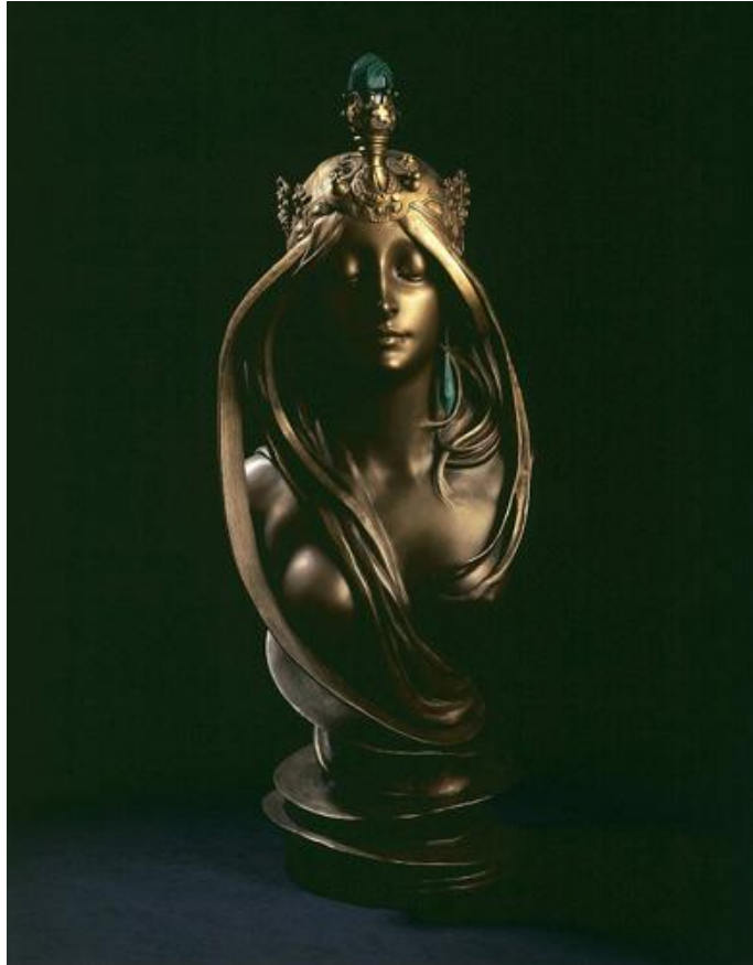
Alphonse Mucha, La Nature, 1899-1900.