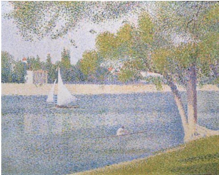
Georges Seurat , La Seine à la Grande-Jatte , 1888 Huile sur toile, 65 x 82 cm