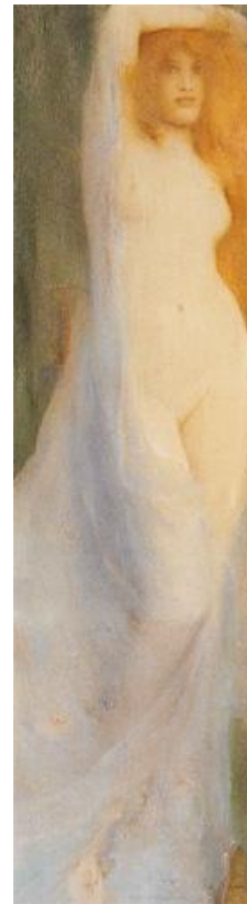
Fernand Khnopff, Acrasia. The Faerie Queen , 1892 © Propriété de la Région de Bruxelles-Capitale En dépôt : MRBAB, Dation Gillion Crowet, 2006 [Bruno Piazza (Gillion Crowet)].

Rendre compte de cette aventure requiert une pluridisciplinarité qui n'est envisageable que grâce à un partenariat qui unit, dans un premier temps, les Musées royaux des Beaux-Arts de Belgique, la Bibliothèque royale de Belgique et le Théâtre royal de la Monnaie. À ces partenaires, il faut ajouter la Région de Bruxelles-Capitale qui mettra en dépôt l'extraordinaire collection Gillion Crowet qui constituera un des points forts et l'aboutissement de notre parcours. Ces synergies sont essentielles pour le développement des établissements scientifiques fédéraux.