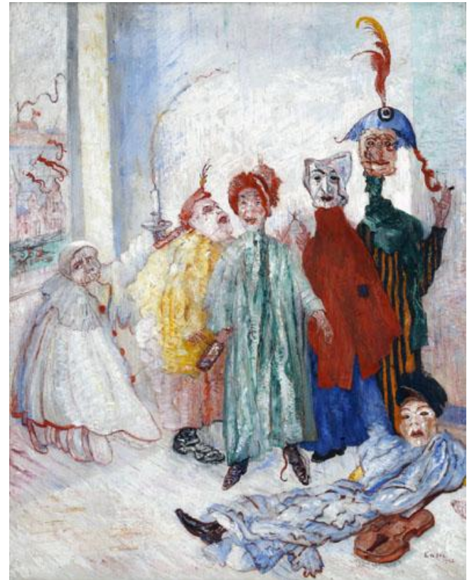
James Ensor , Les masques singuliers , 1892

Depuis 2006, le Musée d'Art moderne, créé en 1984, accueille sur ses six niveaux expositions temporaires et collections consacrées aux XIX e et XX e siècles. Après l'ouverture le 2 juin 2009 du Musée Magritte Museum, qui a déjà accueilli 1.000.000 de visiteurs, le redéploiement des unités muséales qui composent les Musées royaux des Beaux-Arts de Belgique se poursuit. La fermeture du Musée d'Art moderne survenue au 1 er février marque donc une nouvelle étape qui nous conduira à l'automne 2012 à inaugurer notre « Musée Fin de siècle Museum » qui s'imposera comme un des fleurons de notre patrimoine.