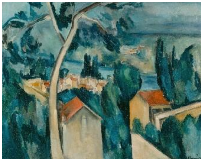
Maurice de Vlaminck, Paysage. La Seine à Chatou, 1907-1908 Huile sur toile, 68 x 73,6 cm

www.extra-edu.be reservation@fine-arts-museum.be Tel. : +32 2 508 33 33