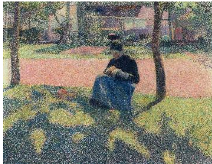
Henry van de Velde , Faits du village. VII. La fille qui remaille, La ravaudeuse , 1890 Huile sur toile, 78 x 101,5