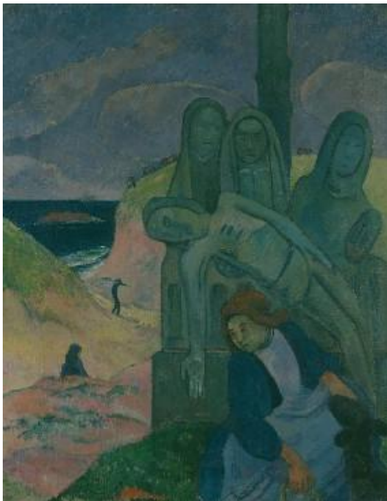
Paul Gauguin , Le calvaire breton, Le Christ vert , 1889 Huile sur toile, 92 x 73,5 cm