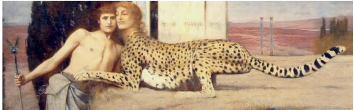
Fernand Khnopff , Des caresses , 1896, L'Art / Les caresses Huile sur toile, 50,5 x 151 cm